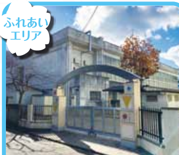
山吹小学校 体育館

文化のみち 二葉館 当日、本チラシご持参の方、入館料割引いたします! 文化のみち 榎木館 ※本チラシ1枚で1グループ何名様でもご利用いただけます。割引の併用はできません。