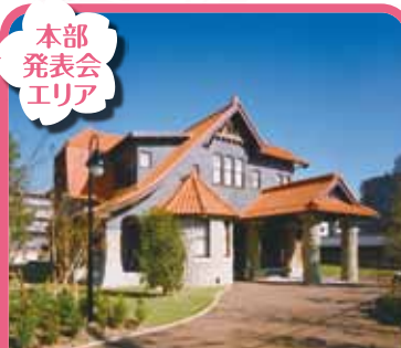
文化のみち 二葉館