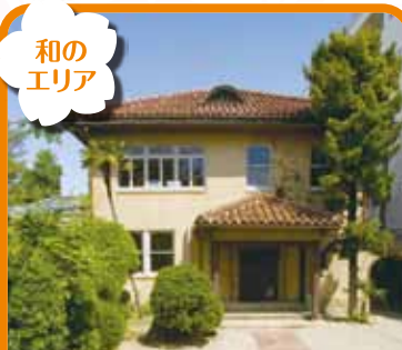
文化のみち 榎木館